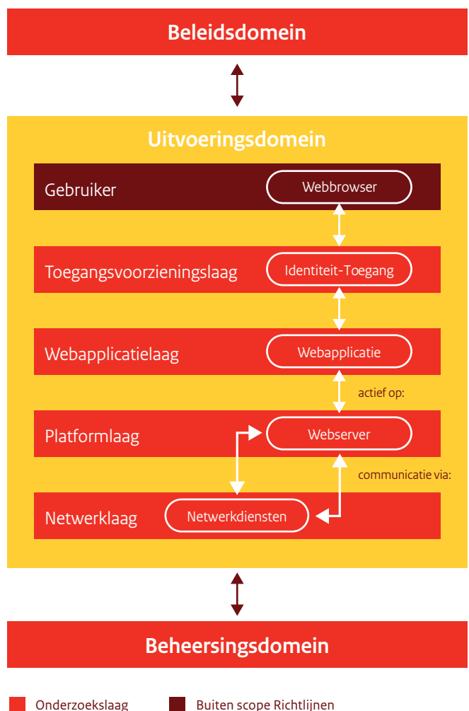
Figuur 2. Indeling van de beveiligingsrichtlijnen

De beveiligingsrichtlijnen zijn, naar de gelijknamige domeinen, georganiseerd in drie hoofdstukken: beleidsdomein, uitvoeringsdomein en control- of beheersingsdomein. Deze indeling komt voort uit het SIVA-raamwerk. Figuur 2 geeft de indeling van de richtlijnen.