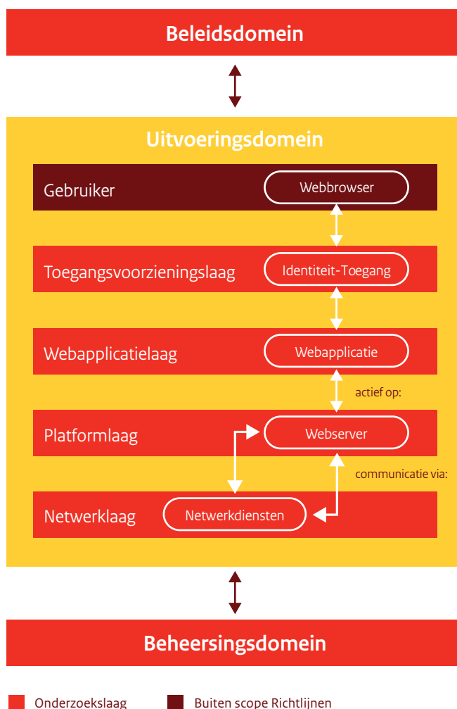
Figuur 2. Indeling van de beveiligingsrichtlijnen

De beveiligingsrichtlijnen zijn, naar de gelijknamige domeinen, georganiseerd in drie hoofdstukken: beleidsdomein, uitvoeringsdomein en control- of beheersingsdomein. Deze indeling komt voort uit het SIVA-raamwerk. Figuur 2 geeft de indeling van de richtlijnen.