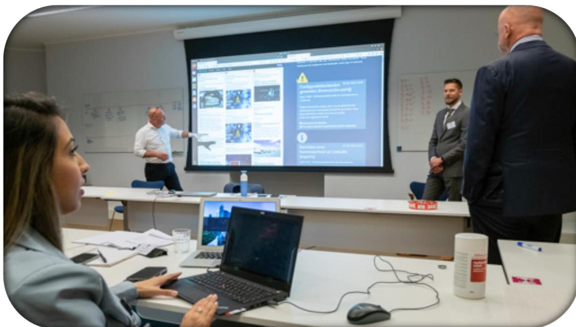
Toelichting foto: de centrale oefenleiding toont minister Grapperhaus de online media- en technische oefenomgeving.